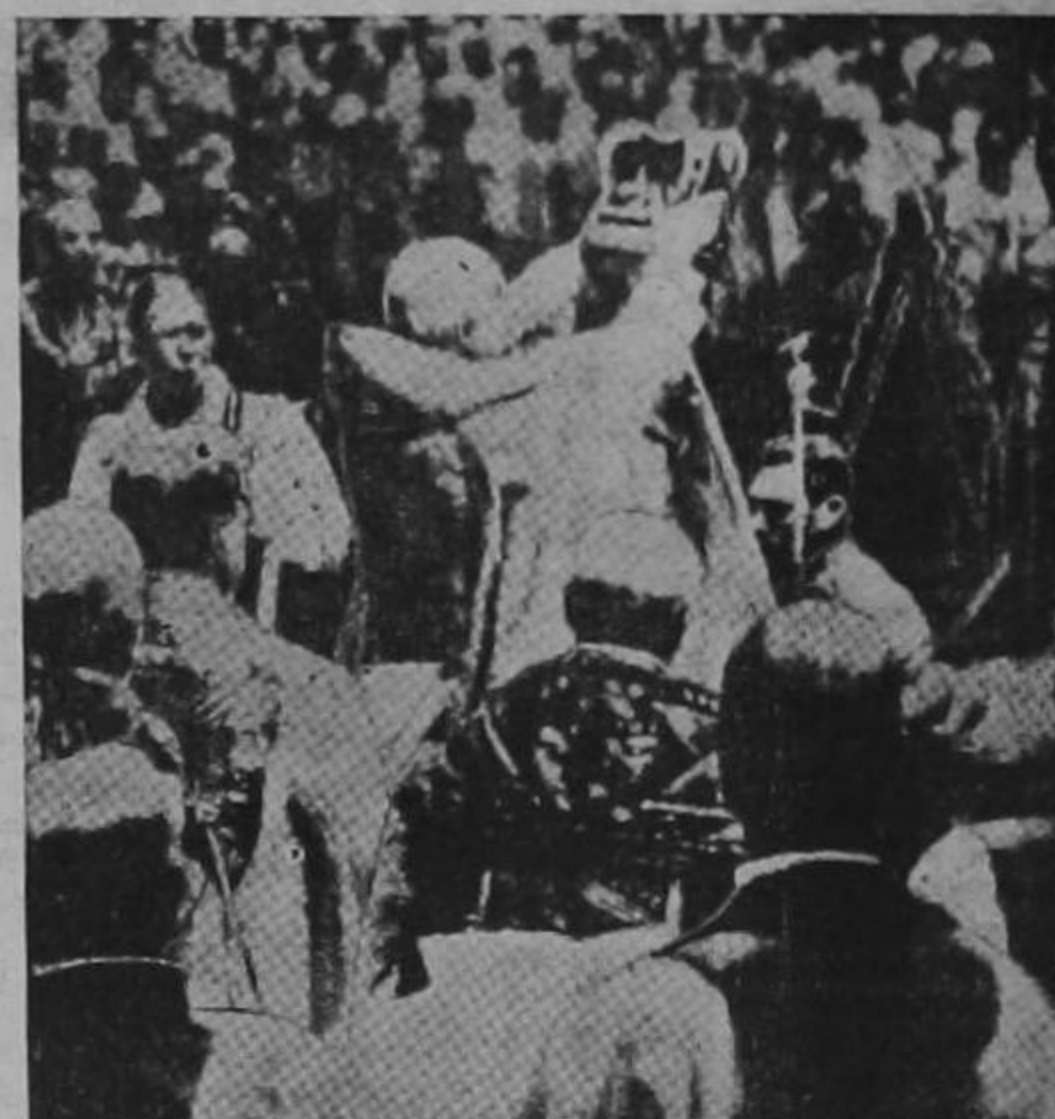
Momentos en el que el Arzobispo de Canterbury coloca la corona de San Eduardo sobre la cabeza del rey Jorge VI. del magnifico servicio recibido hoy por nuestro colega LA TRIBUNA, que ofrecerá en su edición de mañana la más compleja información gráfica sobre la coronación, transmitida por radio de Londres a Nueva York y por avión desde esta última ciudad a Costa Rica.