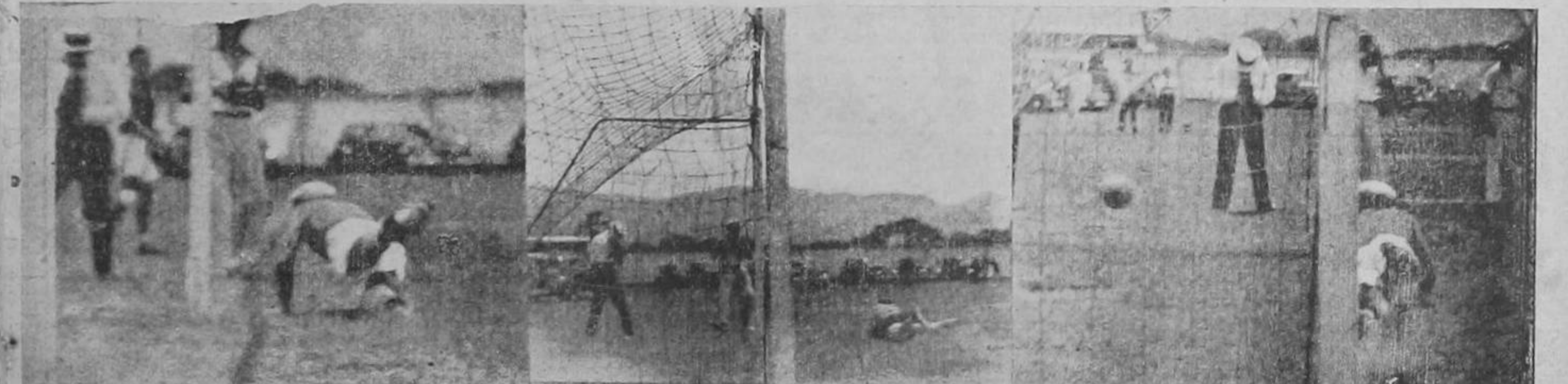
El primer tanto de los argentinos anotado mediante un tiro denos; Calleja por más esfuerzos no pudo evitar la segunda anotación penal; una muy buena intervención de Zurdo, portero de los argentinos.

Nuestra legislación sobre protección a los menores, es una de las más amplias y avanzadas de cuantas existen en América. En gran parte, los nuevos postulados (Pasa a la Pág. OCHO)